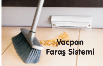
Vacpan Faraş Sistemi

Merkezi Süpürge Sistemlerimizde boru ve fittingslerimizin tamamı emiş için dizayn edilmiş vakum borularıdır. Vakum borularımızın iç yapısı direnç yaratmaz ve emiş gücünü azaltmaz.Zaman içerisinde tıkanma yapmaz.